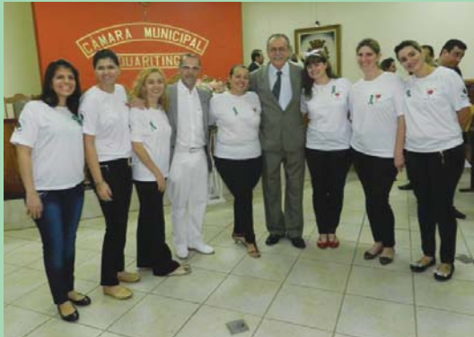
Acima, vereadores com um grupo de funcionárias da Santa Casa