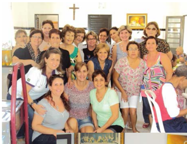
O almoço no Lar São Vicente de Paulo foi realizado no dia 20 pela Fraternidade

Promover ações sociais em benefício do semelhante é um dos grandes objetivos da Fraternidade Feminina Cruzeiro do Sul. No mês de outubro, foram realizadas duas dessas iniciativas. A primeira, no dia 9, reuniu alunos da Associação de Pais e Amigos dos Excepcionais (Apae) em um almoço no Salão de Festas Plínio Favaro, da Loja Maçônica Líbero Badaró. Acompanhados de professores e monitores, os estudantes puderam desfrutar de momentos alegres na Semana da Criança. Já no dia 20, as integrantes da Fraternidade prepararam um almoço especial para os moradores do Asilo São Vicente de Paulo. O evento foi realizado no refeitório da própria entidade.